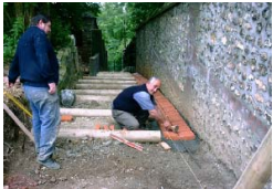
Chantier d'insertion intercommunal: Réalisation du Chemin de la Crèche à Canteleu

Dispositif régional, qualifiant, de préapprentissage, et de réapprentissage