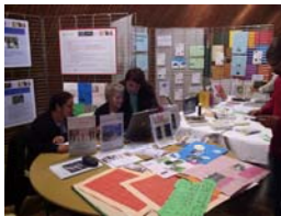
Participation aux forums Emploi-Formation