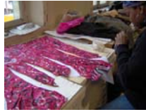
Partenariat Maison des arts - Evreux