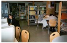
Pôle Ressources de Rouen