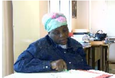
Cours de quartier

Dispositif régional, qualifiant, de préapprentissage, et de réapprentissage