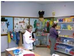
Espace Vente - Filière Vente et Commerce - Dieppe