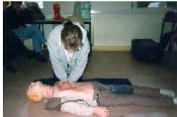
Formation de secourisme à Barentin