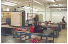
Atelier « Agent d'Entretien des Systèmes Mécaniques Automatisés » du Havre